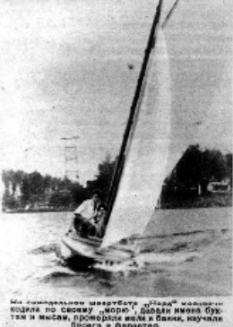
Мы выскочили шхунета «Левый» выскочил кола по своему «море», дашки моряки бухтам и мысам, проверяли места и банки, изучали берега и фарватеры.