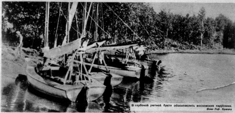
В глубокой уединенной бухте обосновались московские парусники.