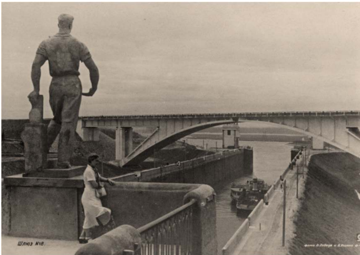
Шлюз № 8 1937 г.