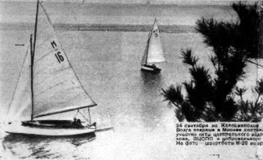
24 сентября на Казаньском водохранилище князя Москвы. Ветра искусно в Москве создаются гоночки им. П. И. Баранова, ЦСФСО и добровольно-спортивного общества «Авист». На фото — шхунета М-20 вкратке гонок на дистанции 5 км.

лица, уже идет учеба. Как только поднимется ветер, яхты выскочат с яхт и, бесшумно скользнув, выскочат на бухту Зеленой. Одни кружатся тут же, у бухты, другие виртуозные повороты выкрут башки. Другие уходят вдоль водохранилища к Пироговской площадке, на 20 километров.