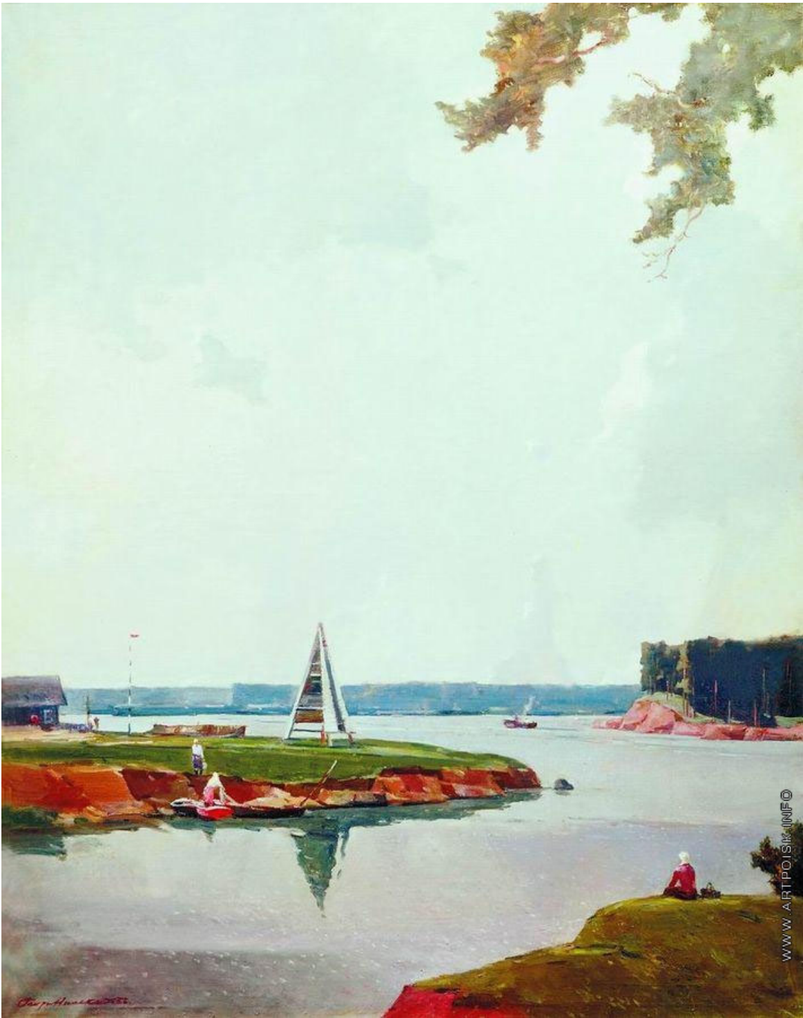
Нисский Г.Г. «После дождя» (1956г.)