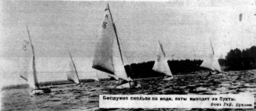
Безудно скольба во вода, яхты выскочат из бухты.