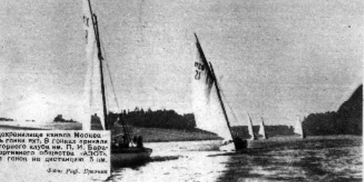
По приглашению Москвы с Балтики приехали морские шхунеты.