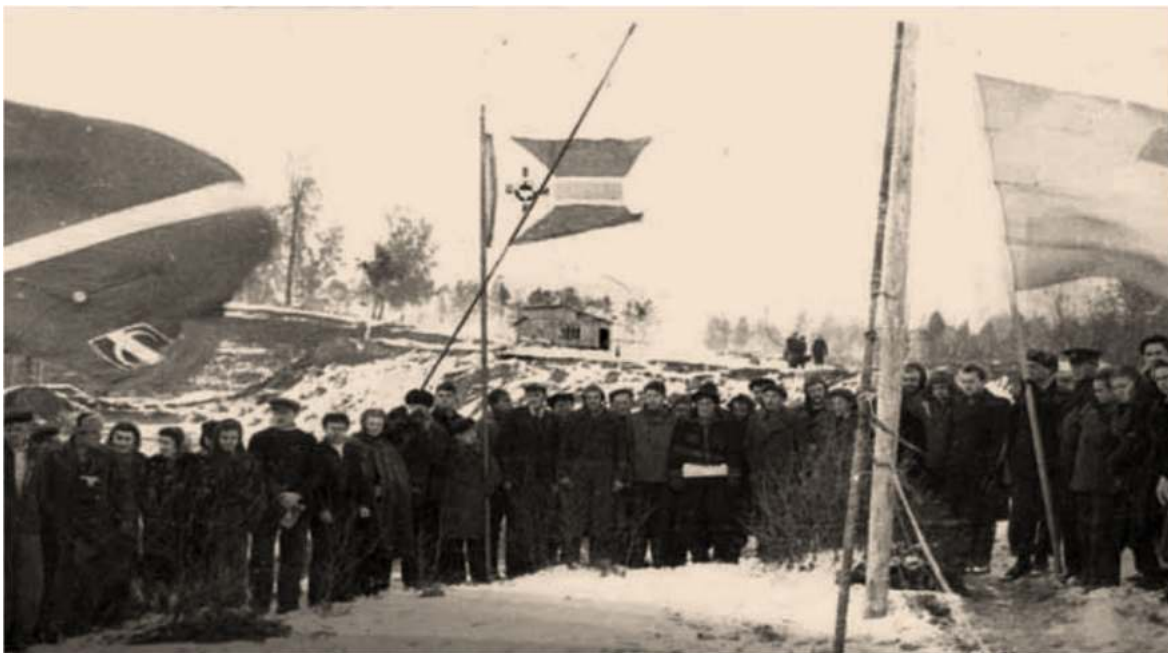
Осень 1937 г. Зеленая Гавань. Закончился первый парусный сезон. На заднем плане строение ЦВМК им. Баранова.