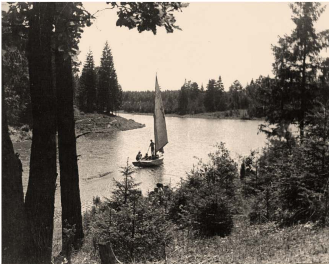
Бухта тайн. Лето 1947г.

В конце бухты над водой проходит ЛЭП и до 60-х годов провода довольно низко провисали над водой.