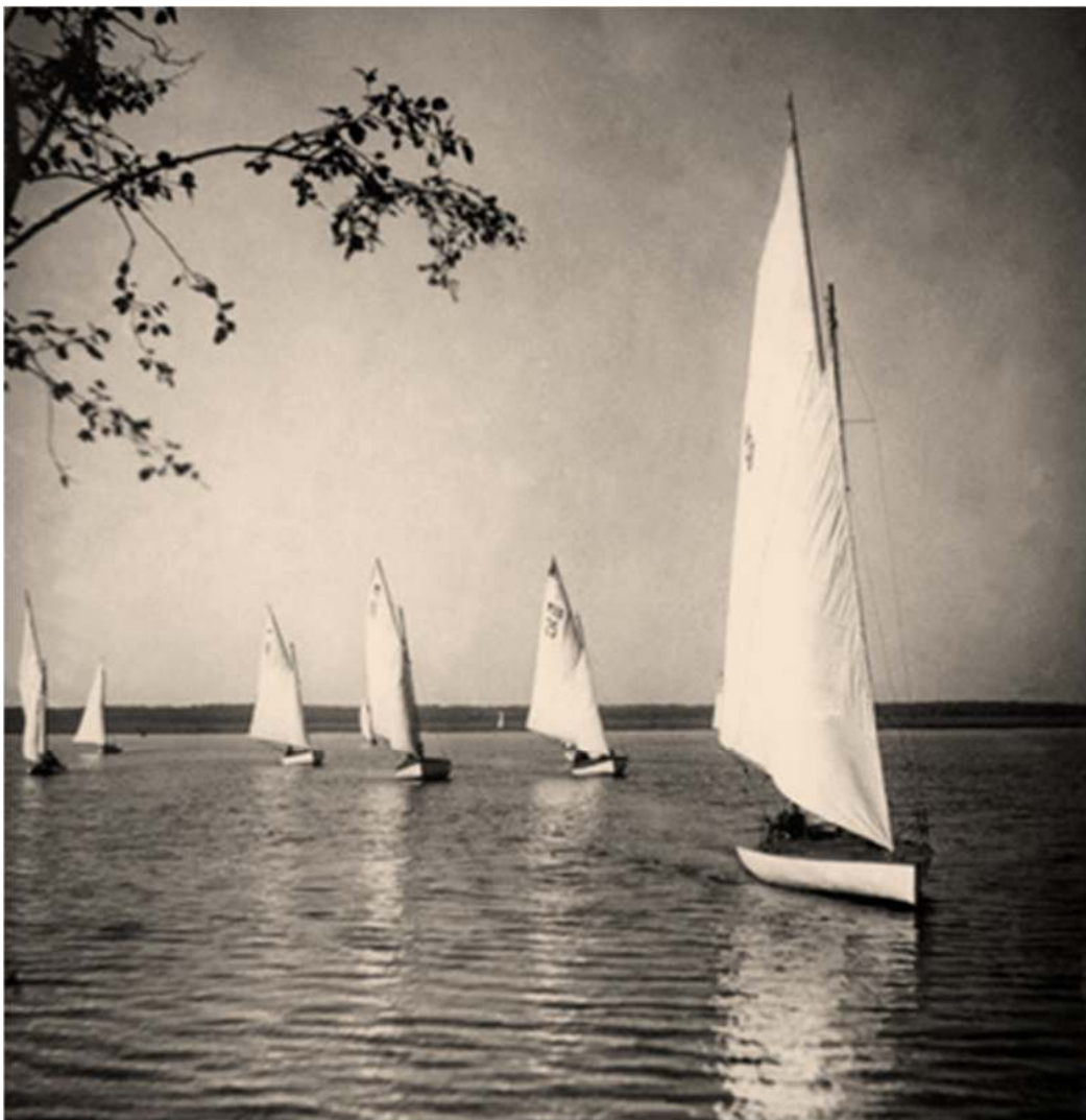
Первые соревнования на Клязьминском водохранилище, 24 сентября 1937 года, гонка на дистанции 5 км.