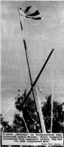
В бухте «Звездиты» на Иллевском водохранилище имени Москвы. Ветра создаются москвичами для парусного спорта. Над бухтой летит советский флаг.