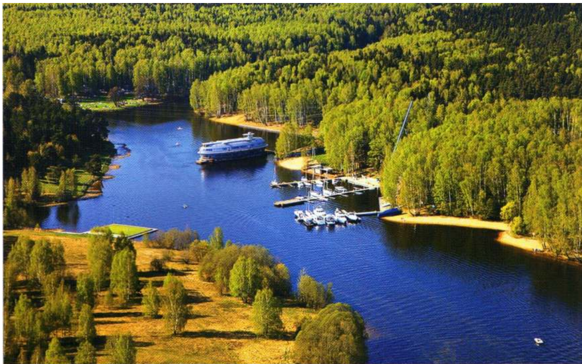
Бухта Семи Утопленников, она же – бухта Трех Мертвецов, бухта Тихая и бухта Тайн. Лодки – яхт-клуб Патриот. 2005г.

А подстриженные газоны и чистенькие галечные тропочки образно переносят в какие-нибудь романтические уголки Финляндии или Германии.