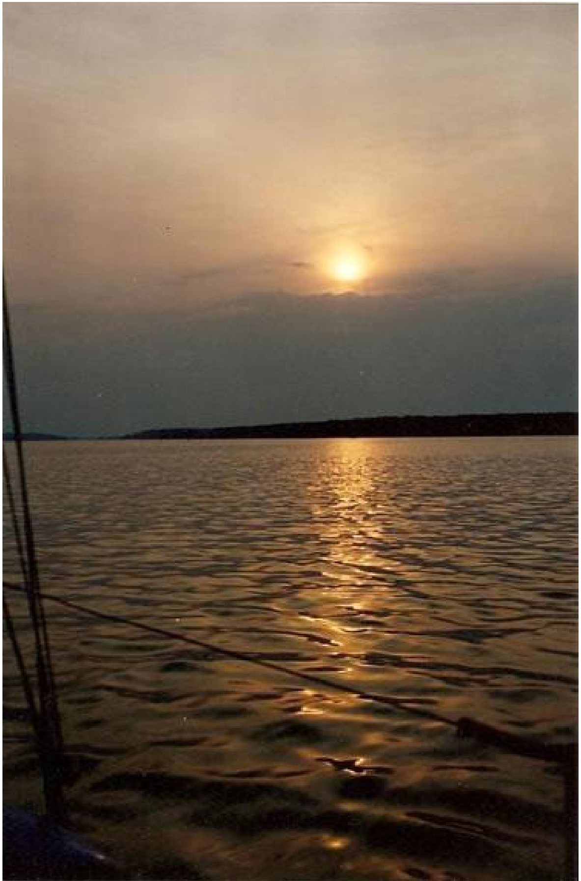
Грозовой фронт. Клязьминское водохранилище. Август. 1968 г.