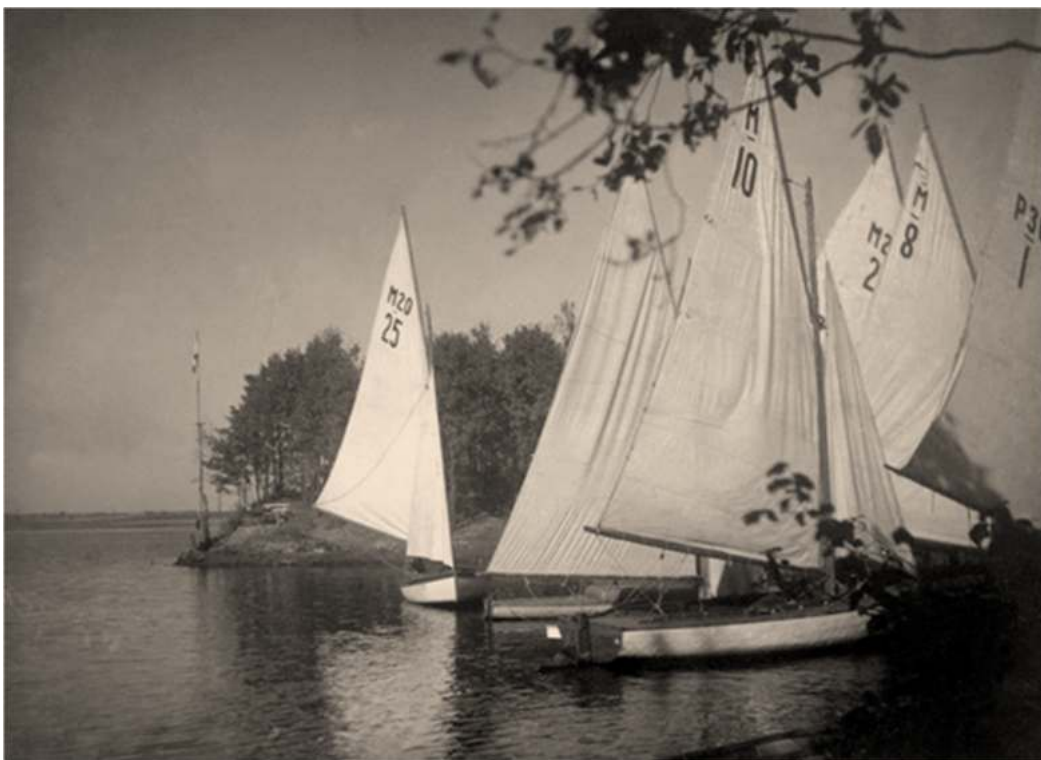
Клязьминское водохранилище, Зеленая бухта, 1937-й год.