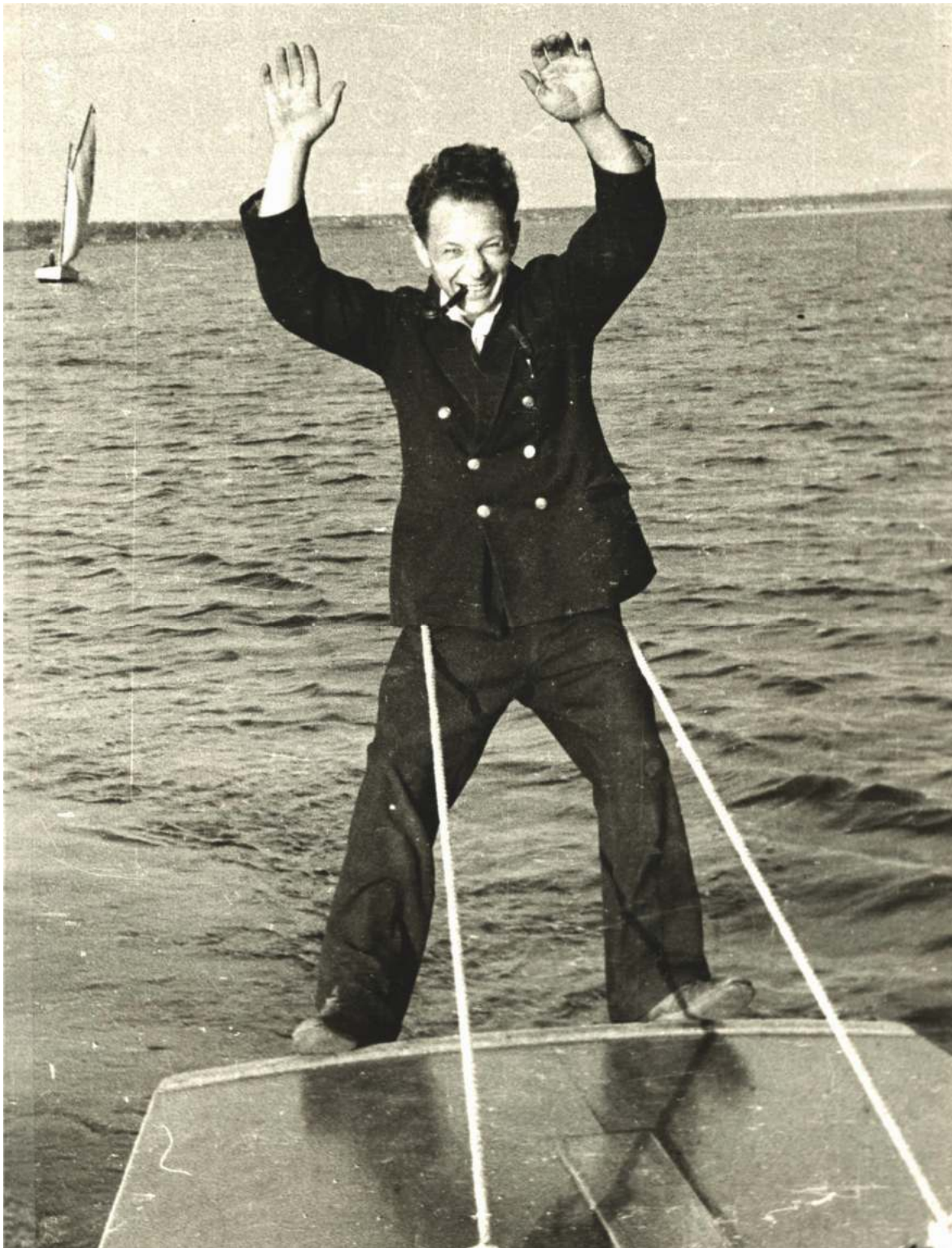
Андрей Сергеевич Некрасов — автор «Приключений Капитана Врунгеля». Клязьминское водохранилище, 1937 г.

В 1937 году с вводом в строй канала имени Москвы вблизи столицы образовалась цепь живописных водохранилищ и на их водах появились редкие в то время белокрылые яхты.