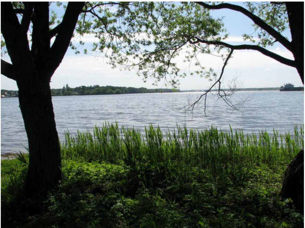
Вид из деревни Чиверево на водохранилище в сторону яхт-клуба «Спартак», откуда стартовала «Секретная Гонка»