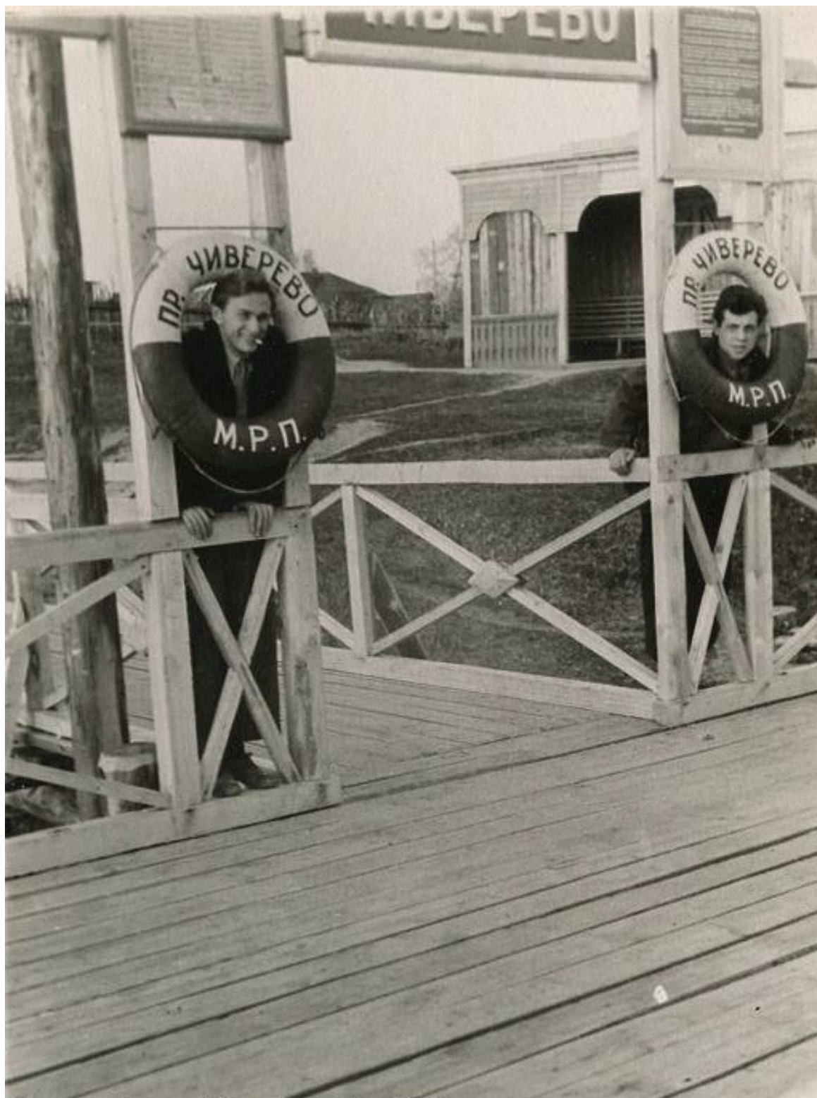
Пристань Чивирево, 1953г.