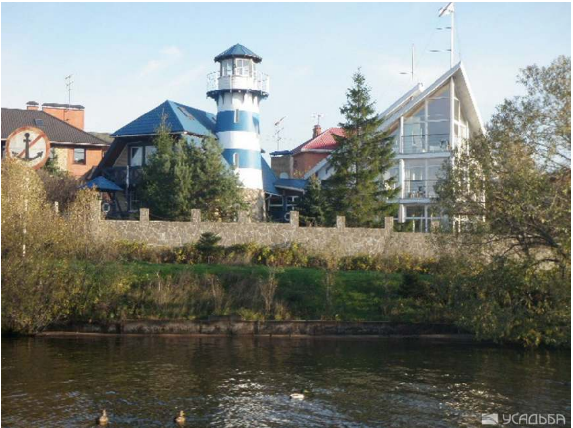
Деревня Чиверево, Здесь находилась дача Андрея Некрасова. 2007г.