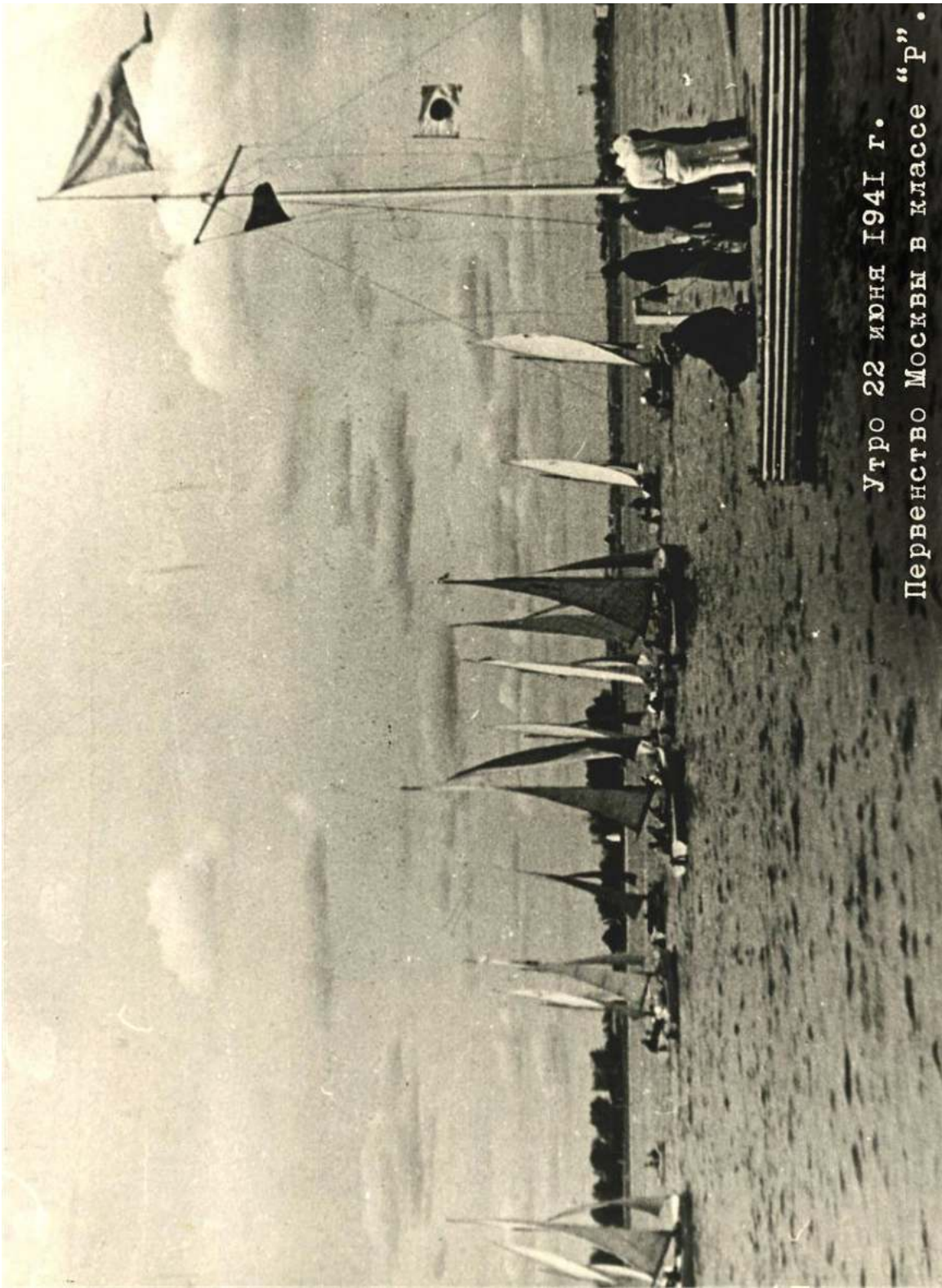
22 июня 1941 г. Ребята стартуют и еще не знают, что началась война