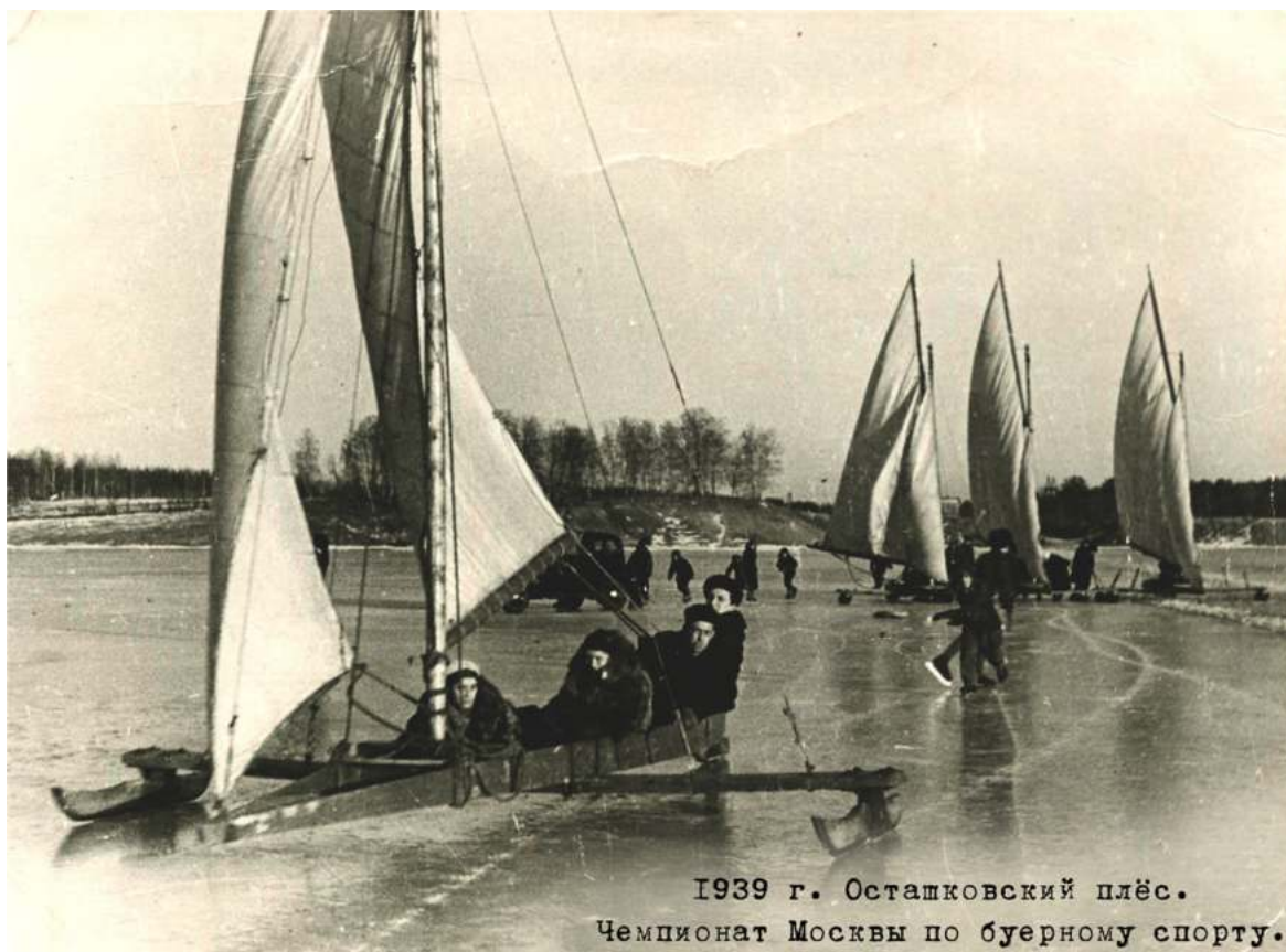
1939 г. Осташковский плёс. Чемпионат Москвы по буерному спорту.