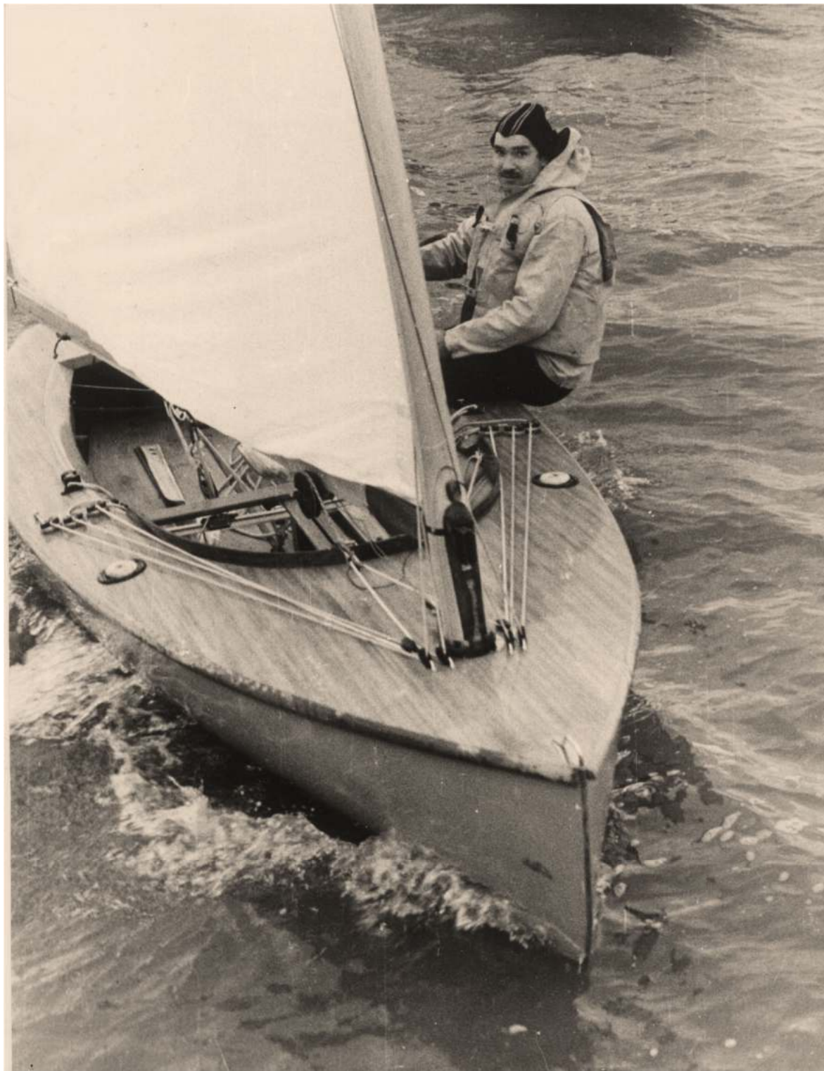
Виктор Потапов - Чемпион. Спартакиада народов СССР. Класс "Финн 1971г.

Его послужной список яхтсмена — гордость нашего клуба. Начинал он гоняться в яхт-клубе «Труд» в 1954 г. — ходил на яхтах класса «Ерш», «Олимпик», «Финн», «470», «Торнадо», «Звездный», «Картер-30». Чемпион Москвы среди юношей и взрослых в 1978-1980 гг. На Олимпийских играх занимал в 1973г. на «Финне» 3-е место, в 1981 — на «470» 4-е место, 1980 — на «Торнадо» 4-е место. Чемпион мира (1978, 1980), чемпион Европы (1981). Обладатель кубка Европы 1981 г. и мира 1988 г. заслуженный мастер спорта СССР, десятикратный чемпион СССР, Кандидат педагогических наук, капитан второго ранга.