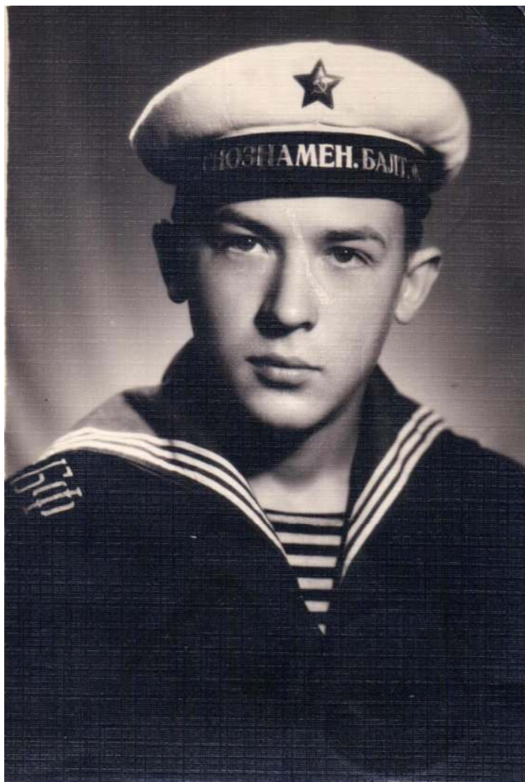
«Дорогой бабушке от любящего внука. «Ты моряк красив сам собою»» Таллин, 16.IX.1962

По возвращении домой вступил в Московский областной клуб ДОСААФ, который находился на берегу Пироговского водохранилища напротив «Бухты Тайн».