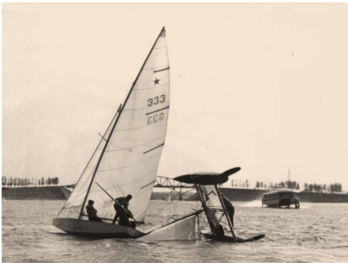
Бывает и так...

Поход проходил нормально. Но не обошлось, конечно, и без незапланированных случайностей.