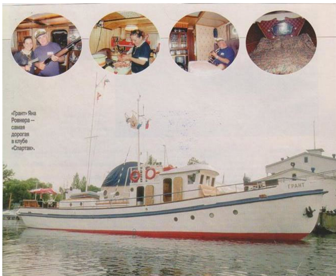
Журнал «Профиль». 1996г.

Его подняли на слип судоремонтного завода рядом со «Спартаком». От клотика до киля очистили от старой краски и ржавчины. Многое повыбрасывали. Кое-что заменили. Добавили нового. Вместо шарового выкрасили в белый цвет, и из водолазного бота получилась шикарная яхта – «Грант».