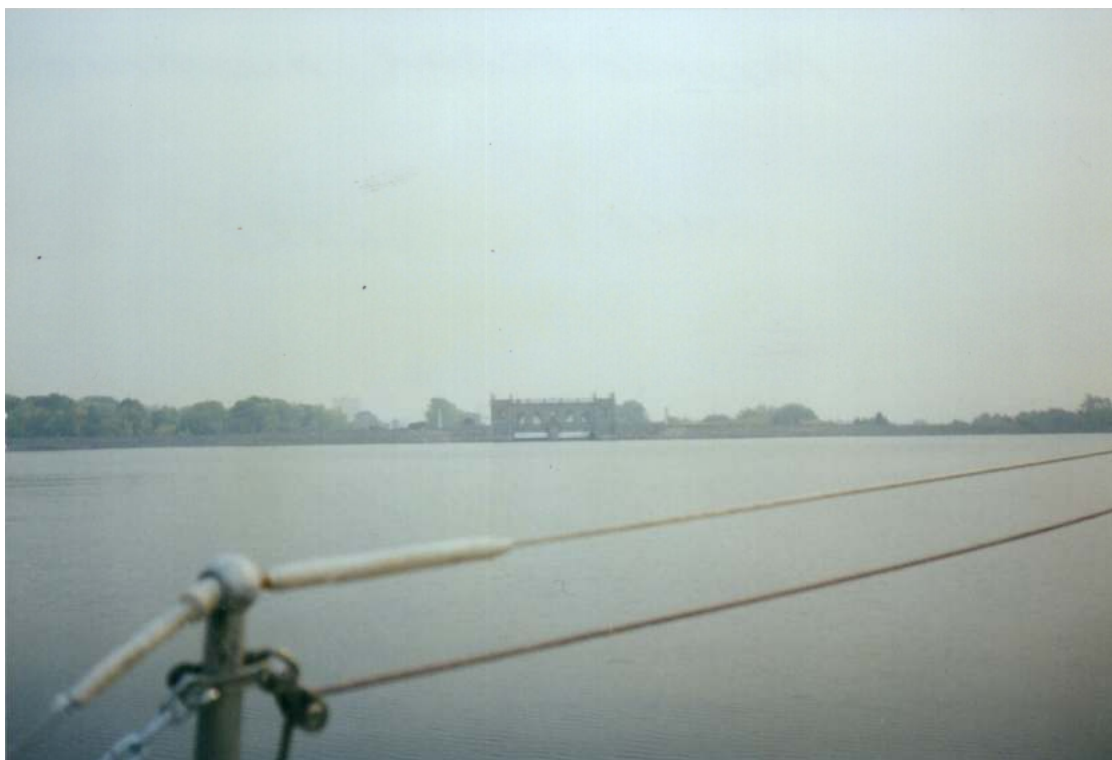
Пироговская плотина. Смог от лесных пожаров . 2002г.

На противоположном берегу, как раз напротив «Дубков» рядом с деревней Подрезово находится грузовая пристань с одноименным названием.