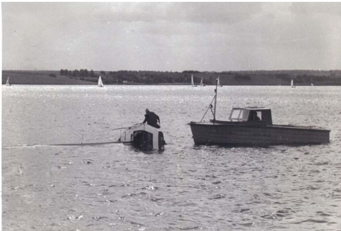
На помощь всегда придет тудяга-катер «Спартак»

Перспектива затонуть в канале меня совсем не устраивала.