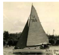
Яхта «Беда». 1947г.