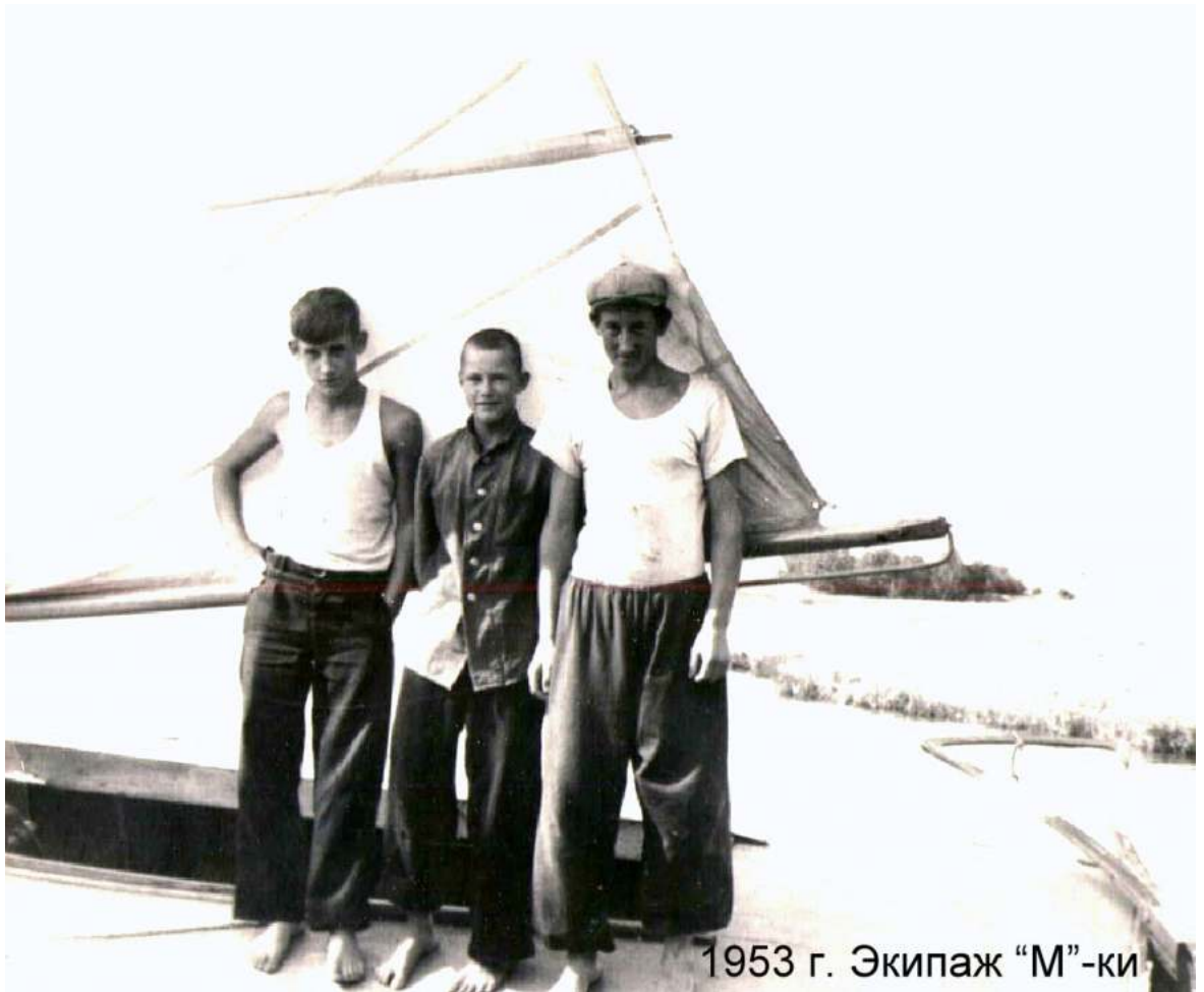
1953 г. Экипаж "М"-ки