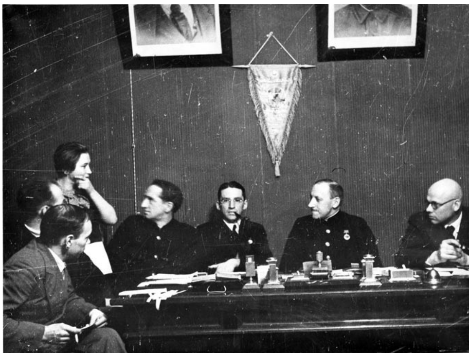
Сдача экзамена на права яхтенного рулевого. 1939г.

В следующем 1939 году экзаменационная комиссия Московского городского комитета физической культуры выдала права яхтенных рулевых более чем 20 новичкам, парусным спортом в столичных яхт-клубах регулярно занимались уже 500 человек, а число вымпелов превысило 200.