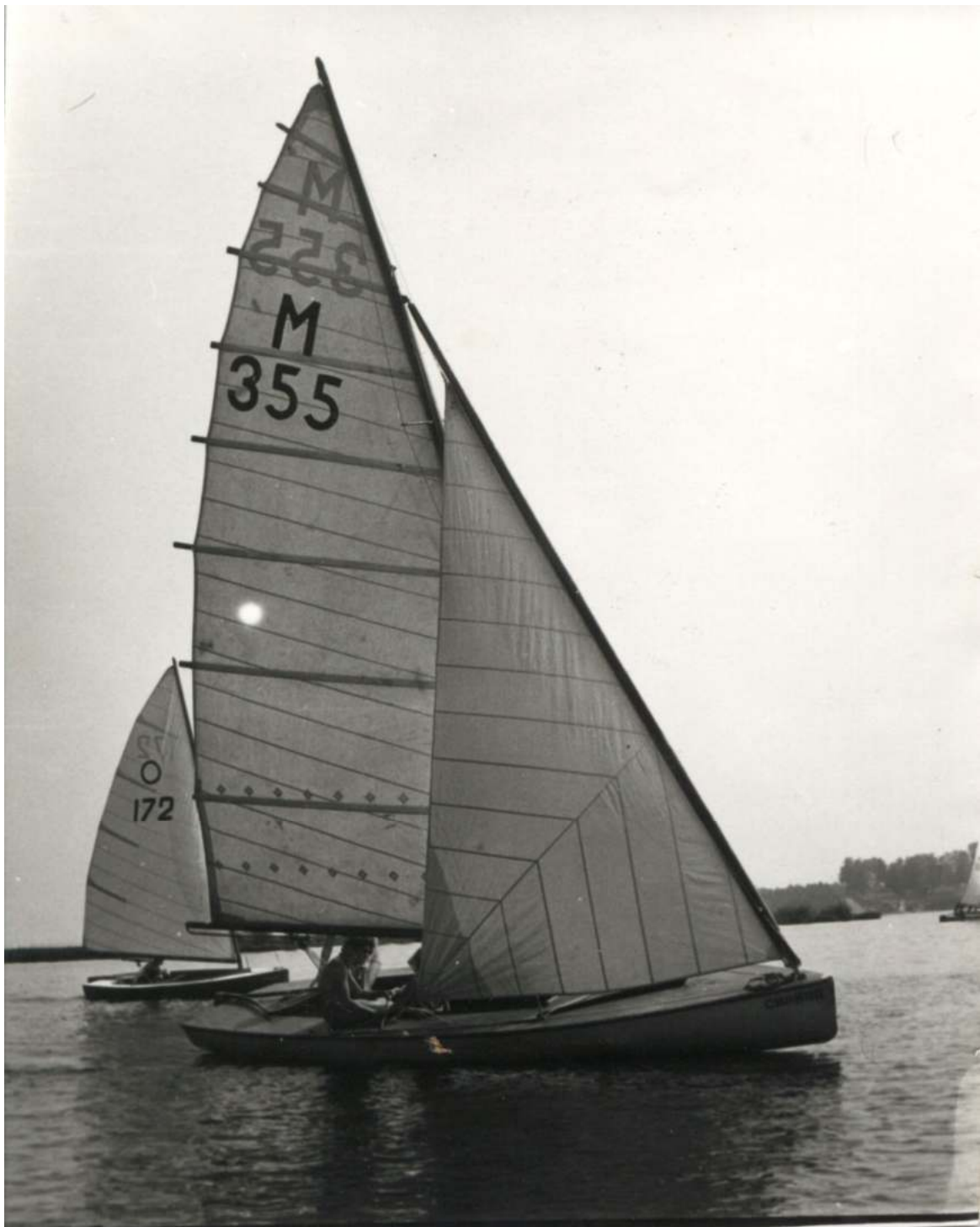
Первые яхты Буревестника – Олимпик и М-ка