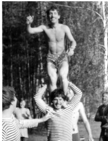
Студенты МИХМ на Острове Б.

В ДСО «Буревестник» все были равны. Независимость статуса на яхте от возраста и должности делала клуб демократичным. Поколения спортсменов с 1950 по 2000 годы, которые выросли в яхт-клубе «Буревестник», с гордостью могут сказать, что у них была счастливая спортивная юность!