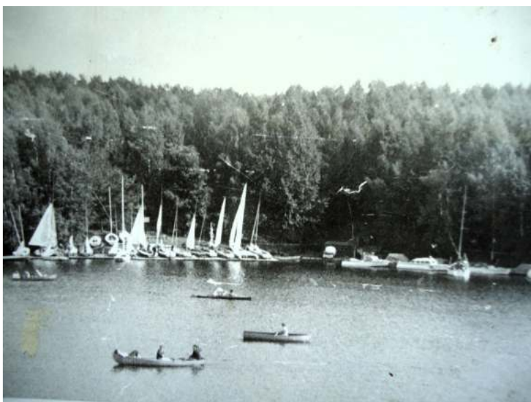
Летние сборы в Дубках

Обучение парусному спорту стало неотъемлемой частью летних спортивных лагерей-сборов